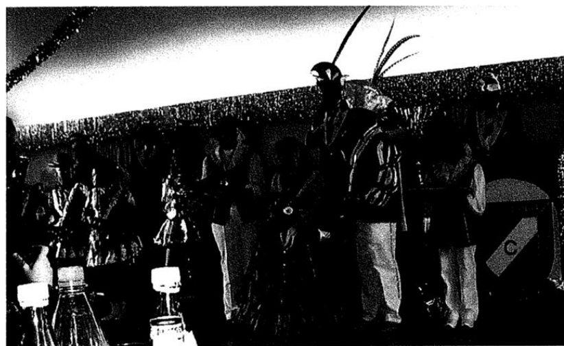
Frish proklamiertes Prinzenpaar mit Gefolge